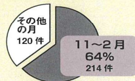
ノロウイルス食中毒の発生時期別の件数(年間)